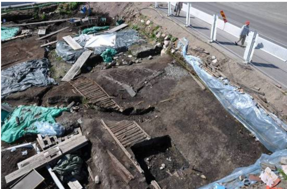
Träbelagd Huvudgatan anlagd vid början av 1200-talet dokumenterad vid utgrävningen av Stadshusparkeringen 2010 (fotgängare till höger går på Västra Kvarngatan framför Stadshuset)

Utgrävningarna av Stadshusparkeringen med början i mars 2010 utvisar i september 2010 att den tidiga bebyggelsen före 1200-talets början bestod av långsmala gårdstomter ner mot ån ca 8 meters bredd och ca 30 meters längd åtskilda av smala gränder. Varje tomt rymde en knapp handfull byggnader bestående av hantverksbod närmast gatan och förrådshus och bostadshus inne på tomten. I början av 1200-talets genomföres en gatureglering som anpassas till kortsidan på tomterna med en noga konstruerad träbelagd huvudgata (ca 1,5 m bredd) parallellt med åbrinken anknuten med gränder belagda med trästockar, kavelbroar. Huvudgatan hade sträckningen korsningen Västra Kvarngatan- Behmbrogatan, mot Slottsgatan över Stallbacken i riktning mot Nyköpingshus parallellt med ån.