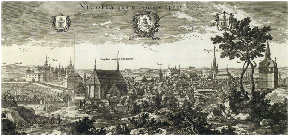
Kopparstick över Nyköping ur Erik Dahlbergs Suecia Antiqua från 1660-talet

(Hämtat ur Nyköpings Minnen; H.O. Indebetou, 1874)